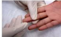
2. Покладіть руку долонею догори. Виберіть палець з найбільш м'якою шкірою