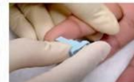
6. Натисніть на ланцет, щоб проколоти шкіру.