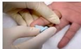
5. Тримайте палець і щільно прикладіть новий стерильний ланцет до подушечки.