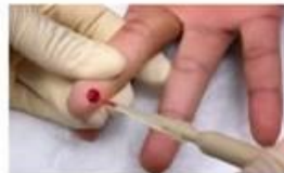
8. Наберіть зразок. Кров буде надходити краще, якщо палець буде нижче від рівня ліктя.