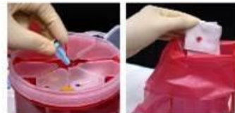
10. Правильно утилізуйте використані предмети