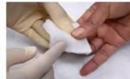
9. Прикладіть марлеву серветку або ватний тампон щоб зупинити кров.