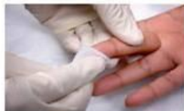
4. Продезінфікуйте палець. Почніть з середини і рухайтесь до кінця щоб запобігти забрудненню. Дайте висохнути.