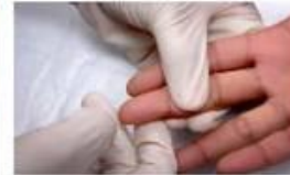
3. Натисніть на середню фалангу щоб кров поступила до кінця пальця