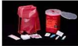
1. Зберіть матеріали

Завжди використовуйте універсальні заходи безпеки